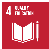
Promover el aprendizaje

En CHG-MERIDIAN queremos dar forma activamente al camino hacia el desarrollo sostenible. Por lo tanto, estamos desempeñando nuestro papel en el logro de los Objetivos de Desarrollo Sostenible (ODS) de la ONU y los consideramos un factor clave para el éxito empresarial futuro.