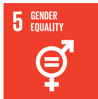
Promover la equidad