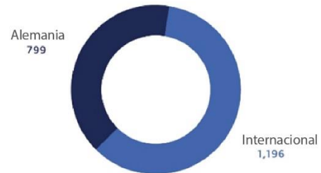
COLOCACIÓN DE NEGOCIO (LEASING) (MILLONES DE EUROS) AL 31 DIC, 2019