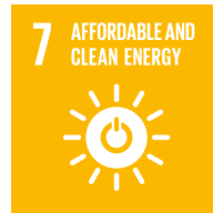
Usar energías verdes