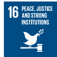
Mantener la integridad