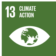
Protección del clima